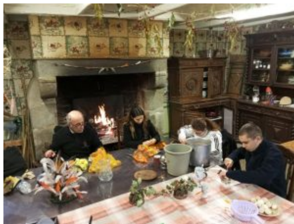
On a aussi la soupe, pour nous réchauffer.