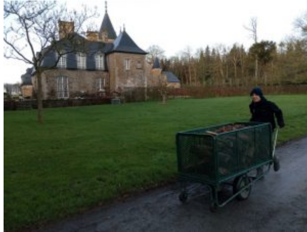
Le charriot est plus lourd à ramener.