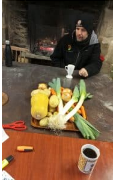
... café, potage, ...