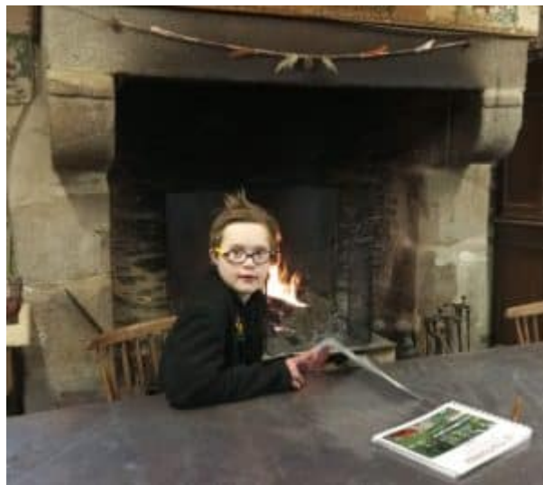
... feu de cheminée, ...